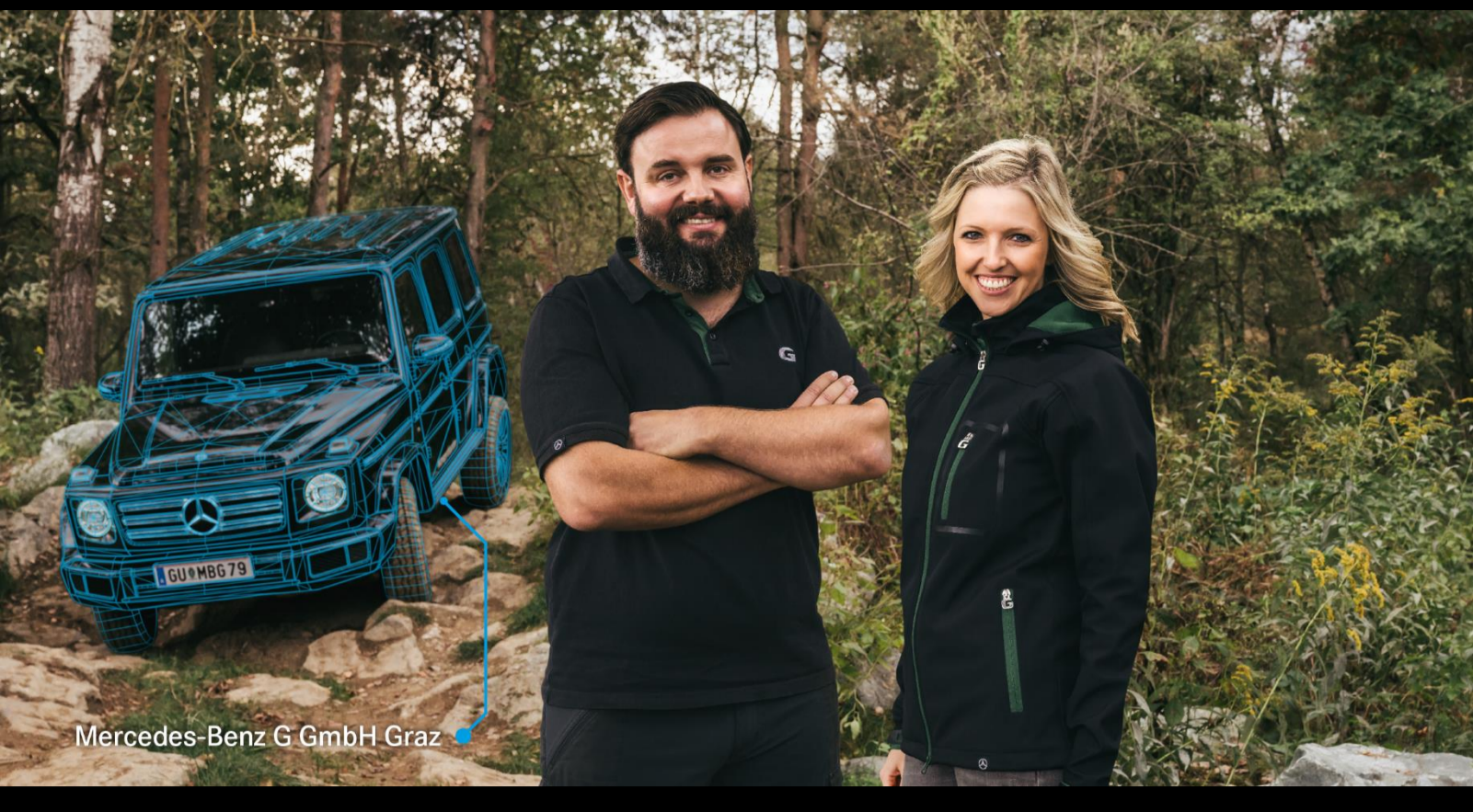
Mercedes-Benz G GmbH Graz